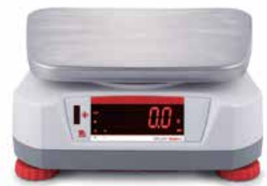
Rückwärtiges Display mit integriertem berührungslosen Sensor